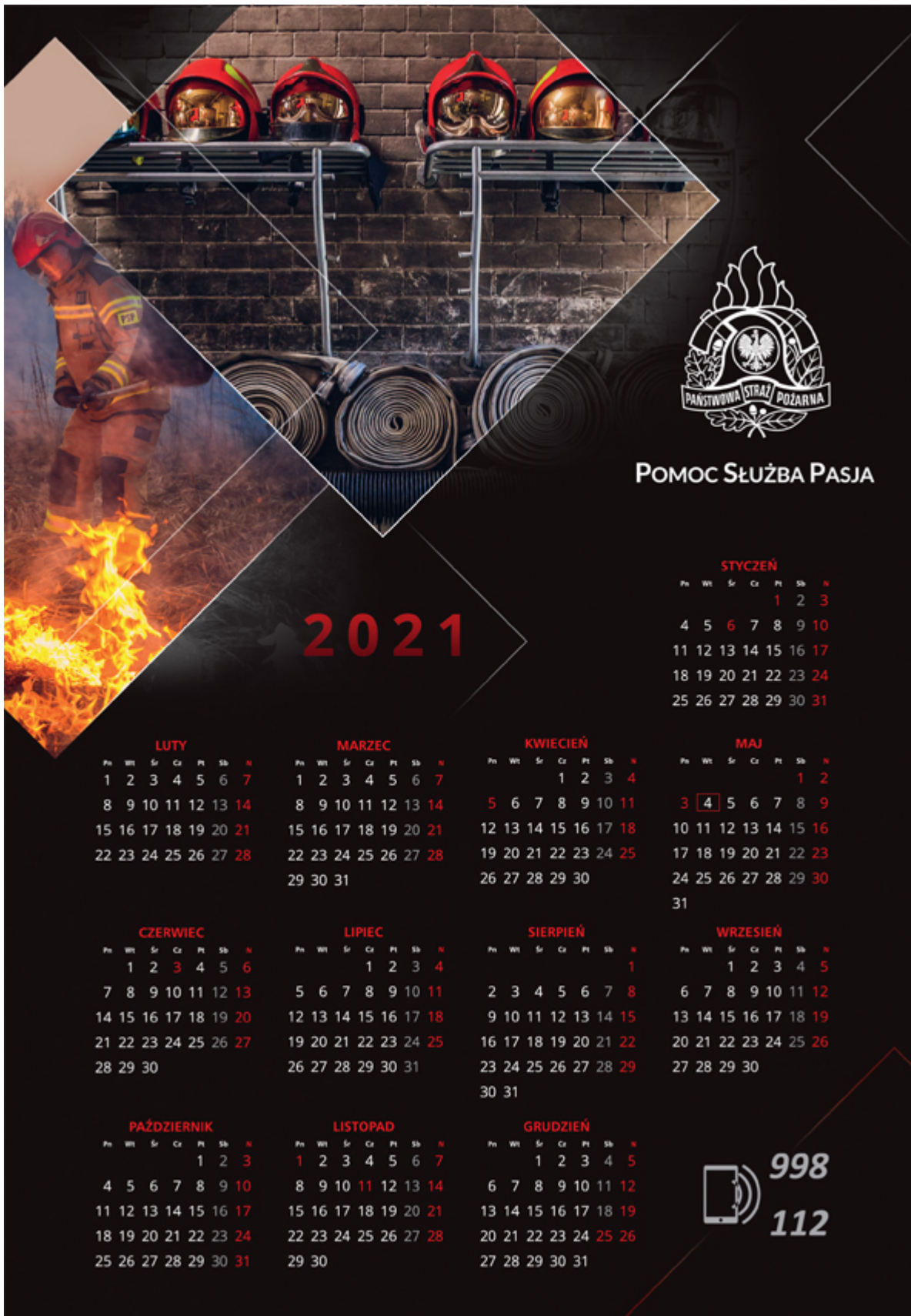
Kalendarz plakatowy KG PSP na rok 2021 – przód